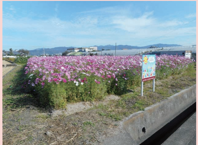
看板も立てました