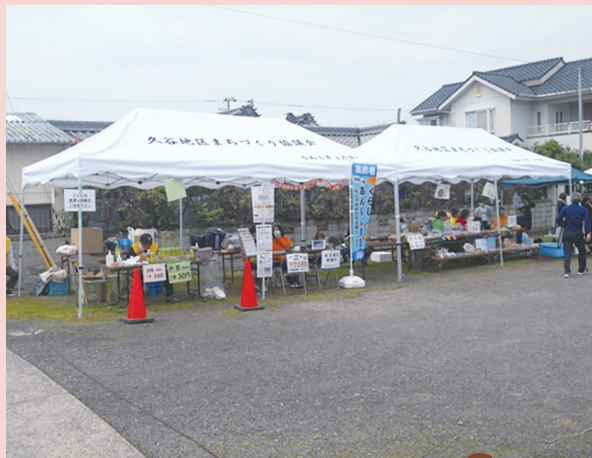
■ 購入したテントをフェスタで初披露