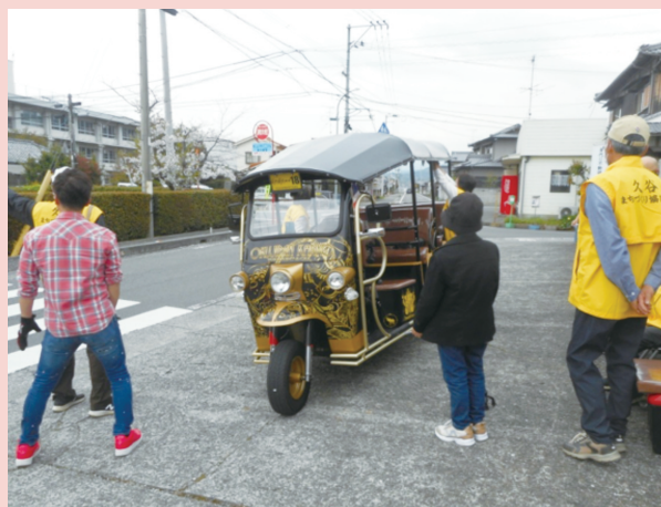
■ トゥクトゥク三輪車による久谷巡り

また、フリーマーケットや地域包括支援センターによる健康相談所も開設し来場者にフェスタを楽しんで頂きました。