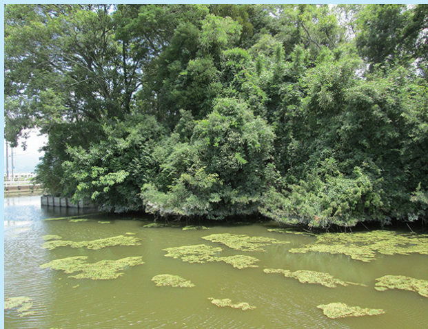
令和5年度 施工箇所 施工前