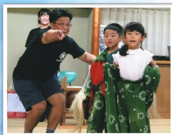
入選 「獅子舞デビュー」

久谷の恵まれた自然・風景や、古くから親しまれてきた歴史文化遺産など「久谷八景」として後世に残したいと感じられる場所や場面をスマホやデジカメ等で撮影して応募しませんか。