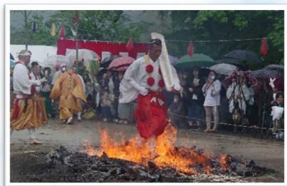
準グランプリ 「火渡り」