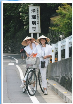
グランプリ 「ちゃりんこ遍路旅」